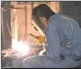
アーク溶接(造園科1年)