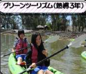
グリーンツーリズム(熱帯3年)