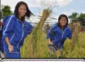
稲刈り体験(熱帯1年)