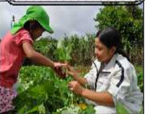
田場幼稚園との交流活動(熱帯2年)