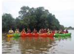
グリーンツーリズム

【資源コースの特色】 資源コースでは「グリーンライフ」(交流・余暇活動型経営の定着・発展)を学習し、農業の多面的機能を肌で体験できる実習を展開しています。また、資源作物の活用を目的に亜熱帯気候を生かした熱帯果樹や野菜、水稲などの作物を栽培しています。収穫後はオリジナルの加工品(お茶、ジュース、クッキー等)の材料としても毎月行われる中農市や即売会でも販売し、地域の方々から好評を得ています。