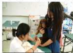
グルーミング実習

動物コースでは、12種26頭の犬を筆頭にウサギやチンチラなどの小動物を教材として飼育しています。科目「動物飼養管理」や「総合実習」では、愛玩動物の飼育管理から犬のしつけ・訓練などについての理論と実践を学習しています。また、沖縄の野生動物など、現代社会における動物たちを取り巻く諸課題について積極的に取り組んでいます。