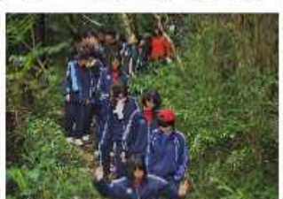
滑らないようにみんな必死です

4月25日から一泊二日で県立名護青少年の家にて宿泊研修が行われました。グループエントランスや全体レクをおし、新しい友達も増え、クラスの団結も強まりました。また名護岳をめぐるハイキングでは、前日の雨で少しぬかるんでいる所もありましたが、一時間程度汗を流しました。夜の研修は、前日の雨で少しぬかるんでいる所もありましたが、一時間程度汗を流しました。夜の研修は、前日の雨で少しぬかるんでいる所もありましたが、一時間程度汗を流しました。