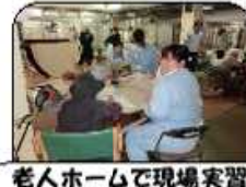
老人ホームで現場実習