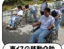
車イスの移動介助